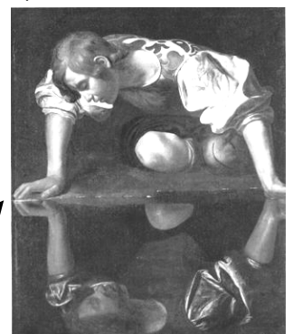
Narcisse peint par LE CARAVAGE 1599